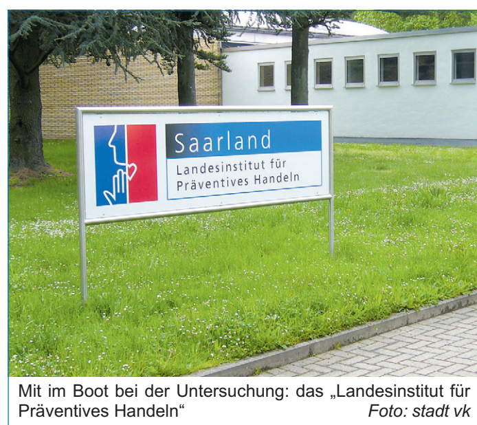
Mit im Boot bei der Untersuchung: das „Landesinstitut für Präventives Handeln“

Unter dem Titel „Sicherheit, Vorbeugung und Verhinderung von Kriminalität“ werden via Zufallsgenerator 1500 Personen in Völklingen willkürlich ausgewählt und angeschrieben. Sie erhalten einen mehrseitigen Fragebogen, mit dem sie ausführlich ihre Ansichten zum Thema Sicherheit und Furcht vor Kriminalität äußern können. Den ausgefüllten Fragebogen senden die Teilnehmer mittels eines beigefügten Freiumschlags anonym an die Stadt Völklingen zurück. Kosten entstehen dabei keine. Die