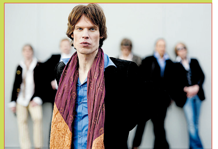
Liefern die beste Rolling Stones-Show Europas: Voodoo-Lounge

Das Familienprogramm am Sonntag: Bigband-Musik am Sonntagmorgen, Kinder-Mitmach- und Showprogramm mit der Tanzschule Bootz-Ohlmann sowie der bekannte Clown Ronald McDonald sorgen für Unterhaltung am Nachmittag. Am frühen Sonn-