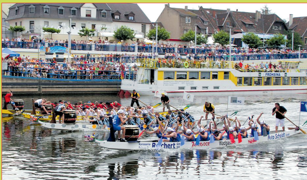
Sind Zuschauer magnet: die Völklinger Drachenbootrennen

Die Drachenbootrennen gehören zum festen Bestandteil. Freitags treten saarländische Schul-Mannschaften an und kämpfen um den Titel. Samstags und sonntags gehört dann den Hobby- und Firmenmannschaften die Saar. Neben dem sportlichen Aspekt sind insbesondere die Kinder- und Familienangebote ein wichtiges Element der Veranstaltung. So gibt es Schnupper-tauchen für Kinder, Karussell-fahrten, Fußballturniere sowie ein buntes Kinderbüh-