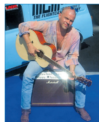
Memphis eröffnet die Kulturreihe