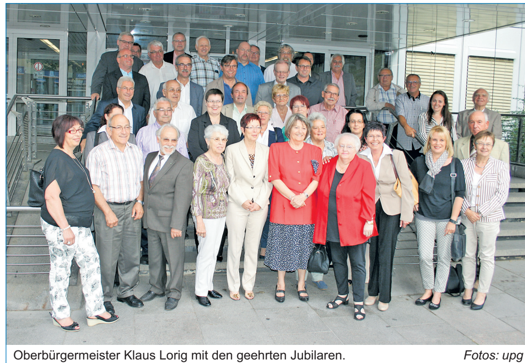
Oberbürgermeister Klaus Lorig mit den geehrten Jubilaren.

Weiterhin unterstrich Lorig die Bedeutung des Ehrenamtes für das Gemeinwesen. Demokratie funktioniere nur, „wenn Menschen sich engagieren, wenn Meinungen ausgetauscht und letztendlich gute Entscheidungen am Ende eines oft langen Diskussionsprozesses getroffen werden. Möglicherweise wird dieser Satz in der letzten Zeit zu oft gesagt, aber es bleibt eine unumstößliche Tatsache: Ohne Ehrenamt wäre diese Gesellschaft viel ärmer.“ Auch wies der Rathauschef auf die Arbeitsbelastung der städtischen Gremien hin, die beträchtlich sei, wie er anhand von Zahlen belegte. Zahlenmäßig drückt sich die Arbeitsleistung des letzten Stadtrates unter anderem in insgesamt 62 Sitzungen aus, die innerhalb der fünf Jahre stattfanden. Da die meisten der getroffenen Entscheidungen in den Ausschüssen vorbereitet wurden, wird das Arbeitspensum der Mitglieder noch deutlicher in der Zahl der Ausschusssitzungen. In-