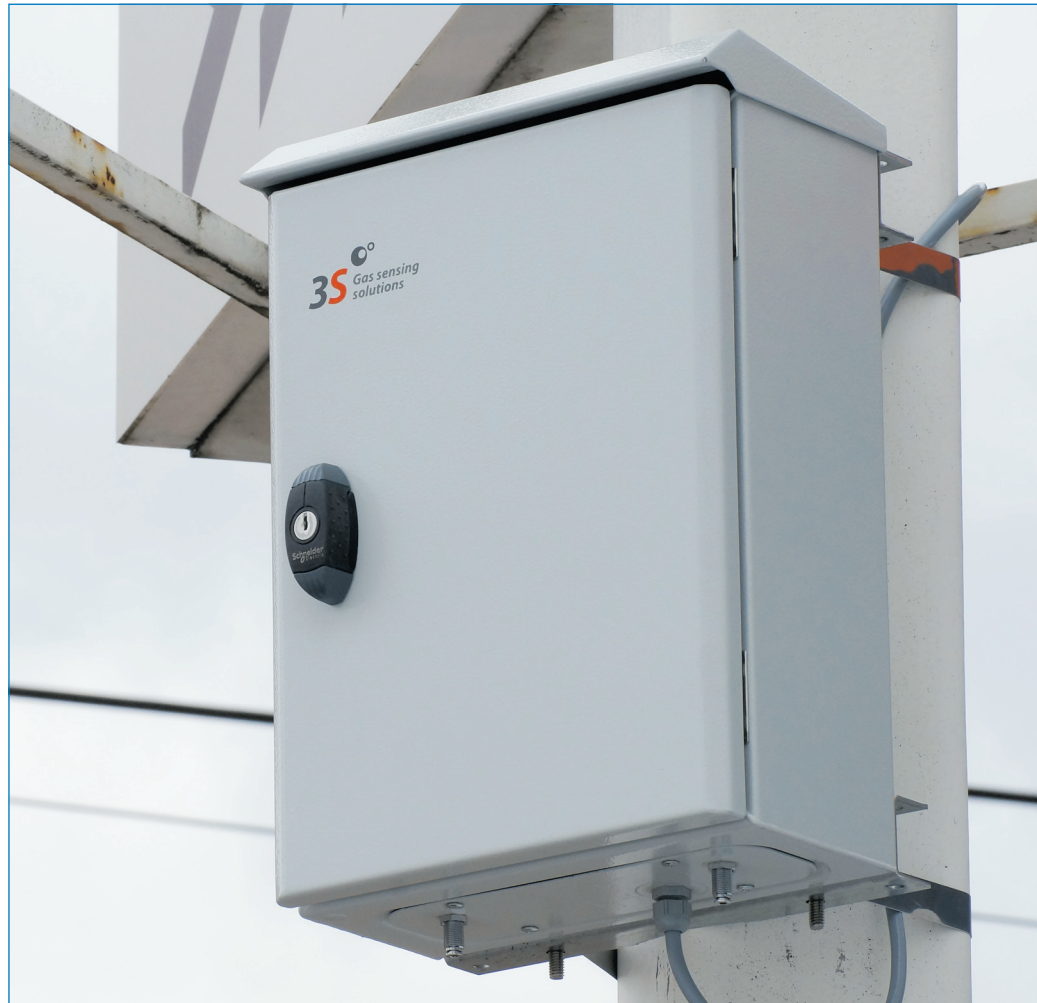
Die Außenmessstation 3S-OdorCheckerOutdoor nimmt rund um die Uhr Umweltdaten auf. Durch Vergleich mit menschlichen Wahrnehmungen kann der Verlauf von störenden Einflüssen aufgezeichnet und objektiv ausgewertet werden.

Übermittlung per Post an 3S GmbH, Mainzer Straße 148, 66121 Saarbrücken