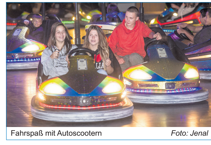
Fahrspaß mit Autoscootern

tet die Vöklinger Herbstkirmes eine Kinderschleife sowie ein Mini-Schiffschaukel. Veranstalter des Spektakels ist die Stadt Völklingen. Im Rahmen der Vöklinger Herbstkirmes findet am Dienstag, dem 23. September von 8 bis 18 Uhr auf dem Adolph-Kolping-Platz, in der City Promenade, im Pfarrgarten sowie in der Forbacher Passage ein Jahrmarkt statt. Cirka vierzig Händler bieten ihr umfangreiches Sortiment an.