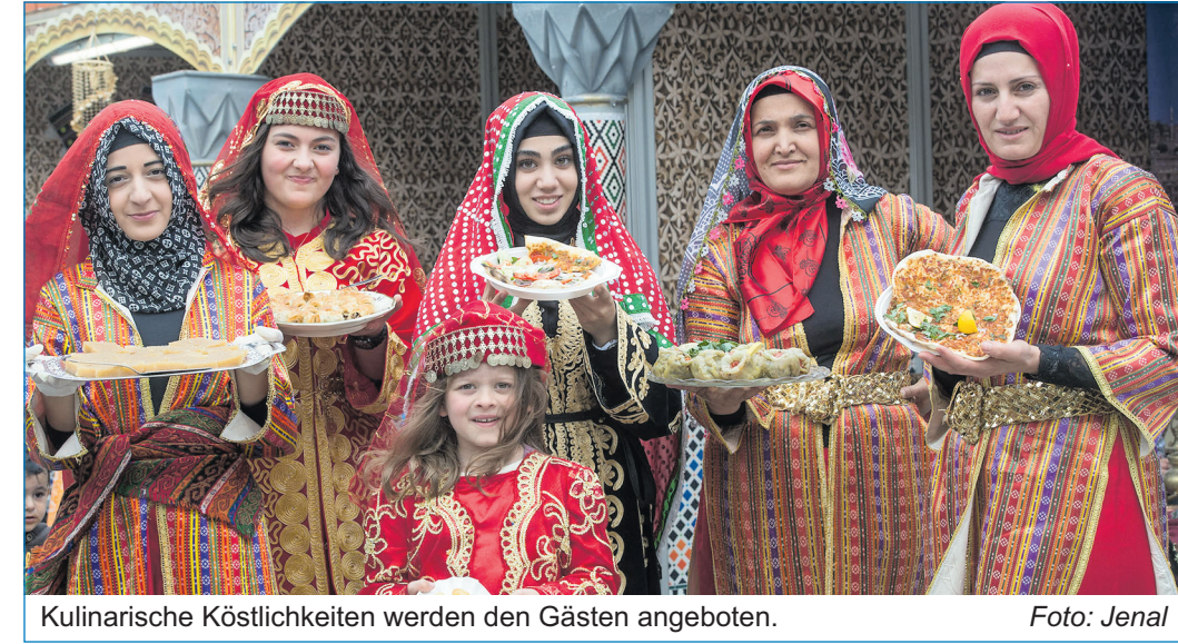
Kulinarische Köstlichkeiten werden den Gästen angeboten.

Die diesjährige Interkulturelle Woche in Völklingen beginnt am 18. September unter dem Motto „Gemeinsamkeiten finden, Unterschiede feiern“. Von 11 bis 13 Uhr startet in den Räumlichkeiten vom Baris e.V. in Völklingen-Wehrden in der Saarstraße 25 die Veranstaltungsreihe mit dem Seminar „Integration ist uns wichtig“, das für Frauen unterschiedlicher Herkunft vom Landesverband Pro Ehrenamt, dem Interkulturellen Kompetenzzentrum und der Stadt Völklingen organisiert wurde. Die Interkulturelle Woche war von Oberbürgermeister Klaus Lorig initiiert worden und ist zu einer Tradition geworden. In diesem Jahr spiegelt sie erneut die Vielfalt und das Miteinander in der Stadt Völklingen wider. Ein Ziel der Woche ist das Eintreten für bessere politische und rechtliche Rahmenbedingungen hinsichtlich des Zusammenlebens von Einheimischen und Zugewanderten. Begegnungen und Gespräche sollen