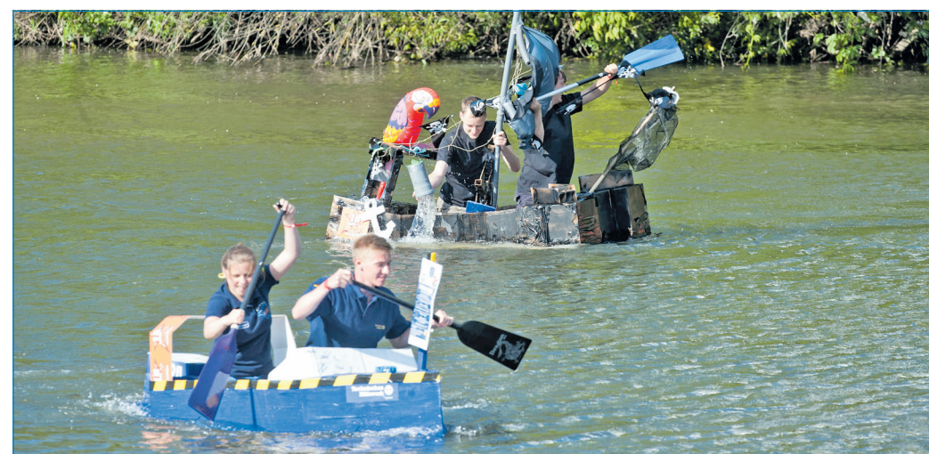
Bei der Premiere im letzten Jahr bereiteten die Pappbootrennen sowohl Zuschauern als auch Teilnehmern großes Vergnügen.