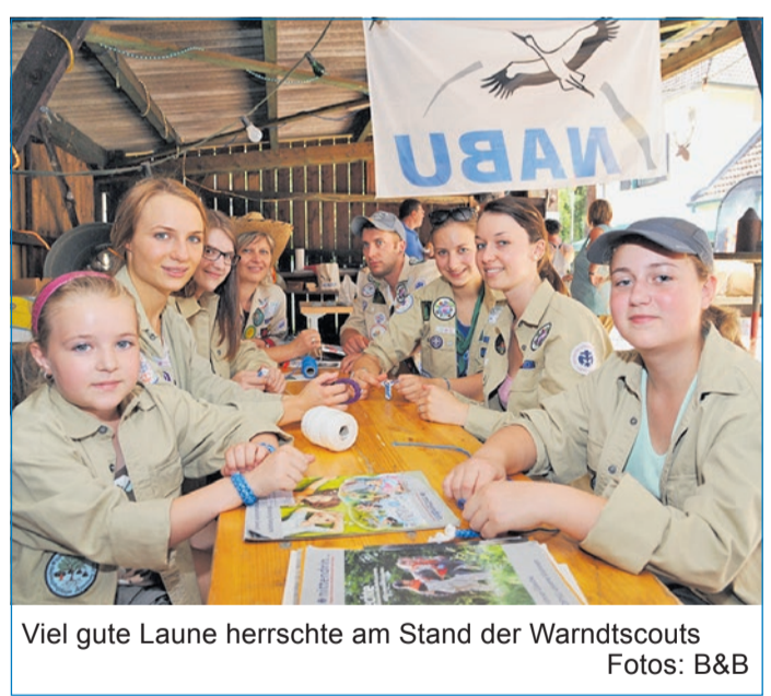
Viel gute Laune herrschte am Stand der Warndtscouts

Sehr interessiert zeigten sich die Völklinger Bürgerinnen und Bürger beim „Tag der offenen Tür“ im Völklinger Forstamt. In seiner Eröffnungsrede hat Völklingens Oberbürgermeister Klaus Lorig auf die Bedeutung des städtischen Forstes hingewiesen. Er sei nicht nur wirtschaftlich von Bedeutung, sondern erfülle auch eine wichtige ökologische und für die Völklinger eine wichtige Naherholungsfunktion. Der Tag der offenen Tür sei deshalb auch eine gute Gelegenheit, auf diese wichtigen Funktionen hinzuweisen. Musikalisch passend umrahmt wurde die Eröffnung vom Jagdhornbläsercorps Dietrichsberg. Anschließend ehrte Lorig vier Familien, die sich ehrenamtlich um „Diehl's Hütte“ in Ludweiler kümmern. Als Dankeschön gab es jeweils einen Präsentkorb. Es handelt sich um die Familien