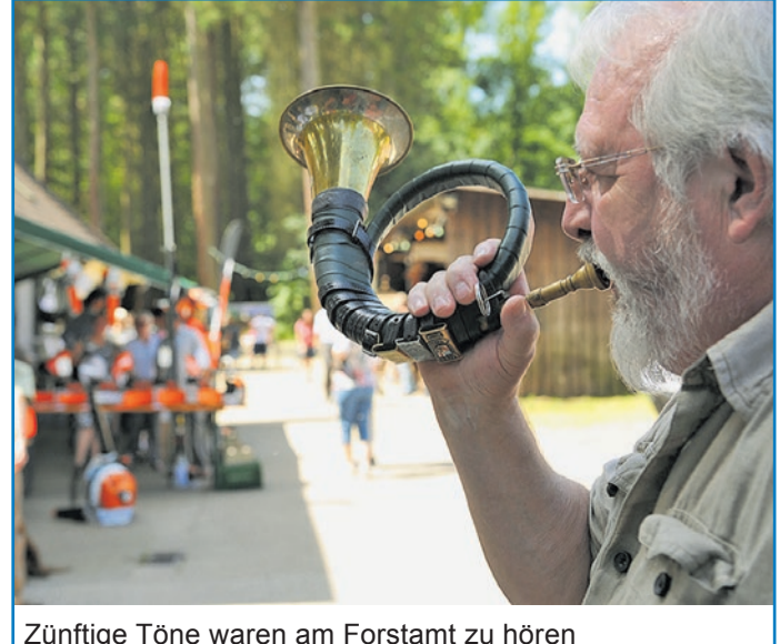
Zünftige Töne waren am Forstamt zu hören

Sehr interessiert zeigten sich die Völklinger Bürgerinnen und Bürger beim „Tag der offenen Tür“ im Völklinger Forstamt. In seiner Eröffnungsrede hat Völklingens Oberbürgermeister Klaus Lorig auf die Bedeutung des städtischen Forstes hingewiesen. Er sei nicht nur wirtschaftlich von Bedeutung, sondern erfülle auch eine wichtige ökologische und für die Völklinger eine wichtige Naherholungsfunktion. Der Tag der offenen Tür sei deshalb auch eine gute Gelegenheit, auf diese wichtigen Funktionen hinzuweisen. Musikalisch passend umrahmt wurde die Eröffnung vom Jagdhornbläsercorps Dietrichsberg. Anschließend ehrte Lorig vier Familien, die sich ehrenamtlich um „Diehl's Hütte“ in Ludweiler kümmern. Als Dankeschön gab es jeweils einen Präsentkorb. Es handelt sich um die Familien