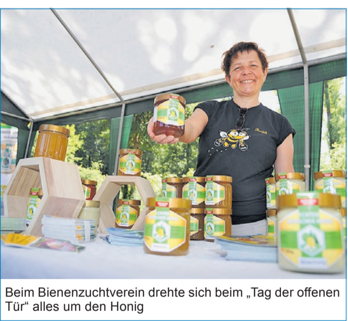
Beim Bienenzuchtverein drehte sich beim „Tag der offenen Tür“ alles um den Honig

Völklinger zeigten sich sehr interessiert an Arbeit des städtischen Forstes