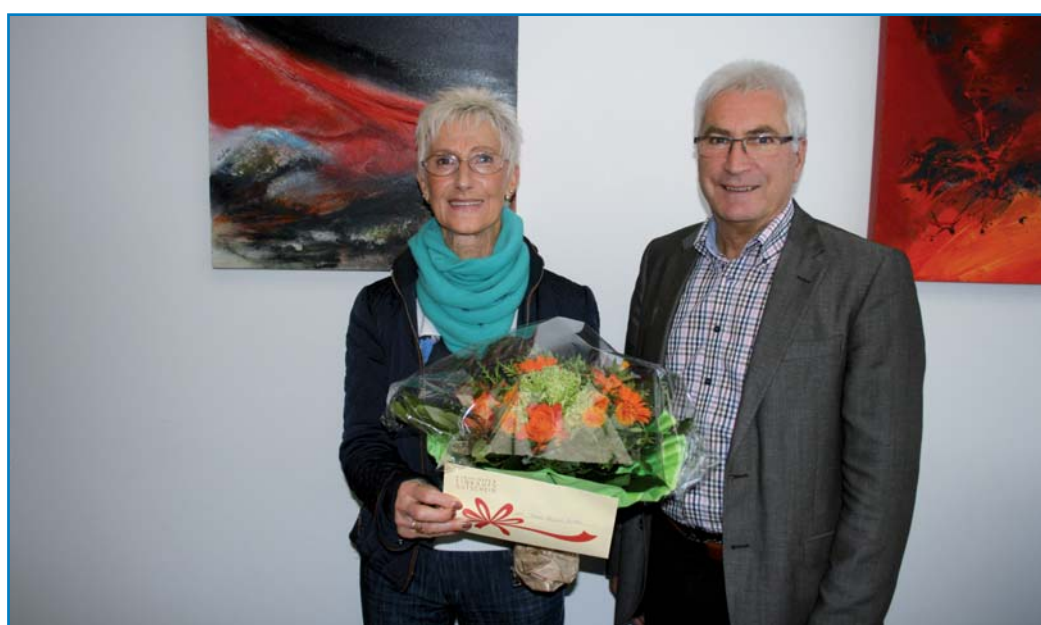
Die neue Weltmeisterin Elvira Richter und Oberbürgermeister Klaus Lorig

Die Abfahrtszeit ist am 13. Dezember, um 13 Uhr, ab Hindenburgplatz, am Neuen Rathaus. Die Rückfahrtszeit kann schon beim Kauf der Platzkarte gewählt werden. Es ist wahlweise eine Rückfahrt um 17 Uhr oder 17.30 Uhr ab St. Wendel möglich.