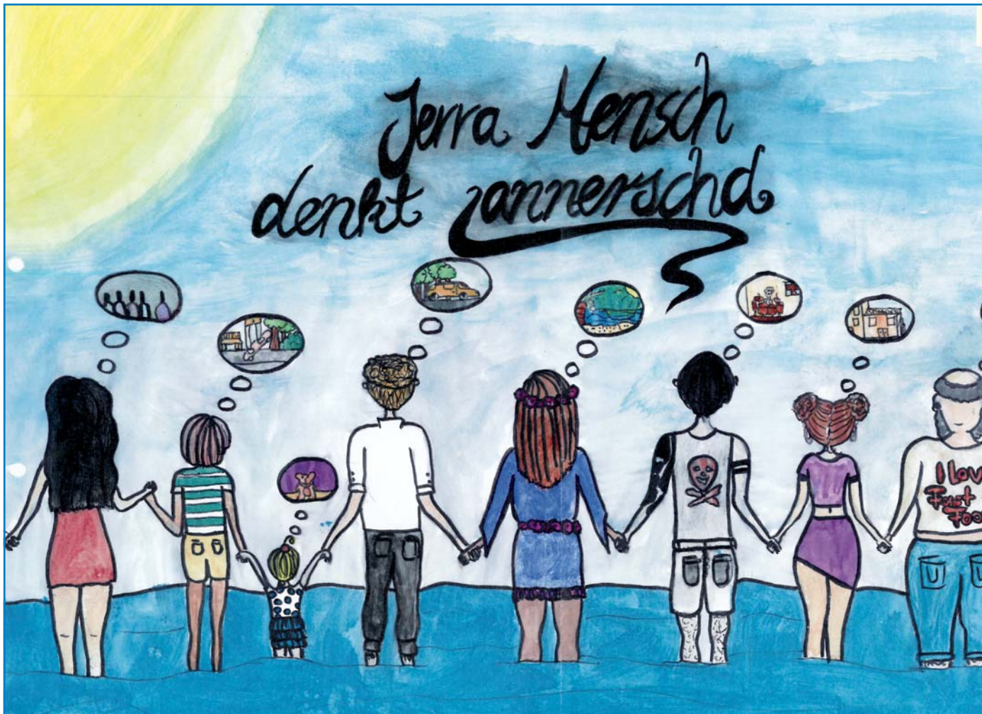
Preisgekrönter Cartoon von Johanna Alt

Für unverlangt eingesandte Artikel übernimmt die Redaktion keine Haftung.