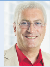
Kultur und Mitgestaltung