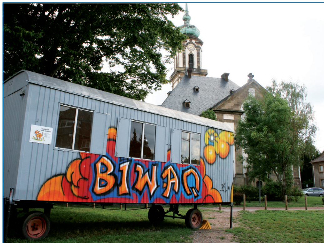
Der BIWAQ-Bauwagen dient Hausmeistern und Gärtnern des interkulturellen Gartens als Unterstand bei Regen

Leider wird derzeit die Freifläche noch allzuoft als Hundeklo benutzt, was die notwendigen Mäharbeiten für die Mitarbeiter von BIWAQ erschwert. Ein entsprechender Tütenspenden für die Hundebesitzer wurde inzwischen installiert.