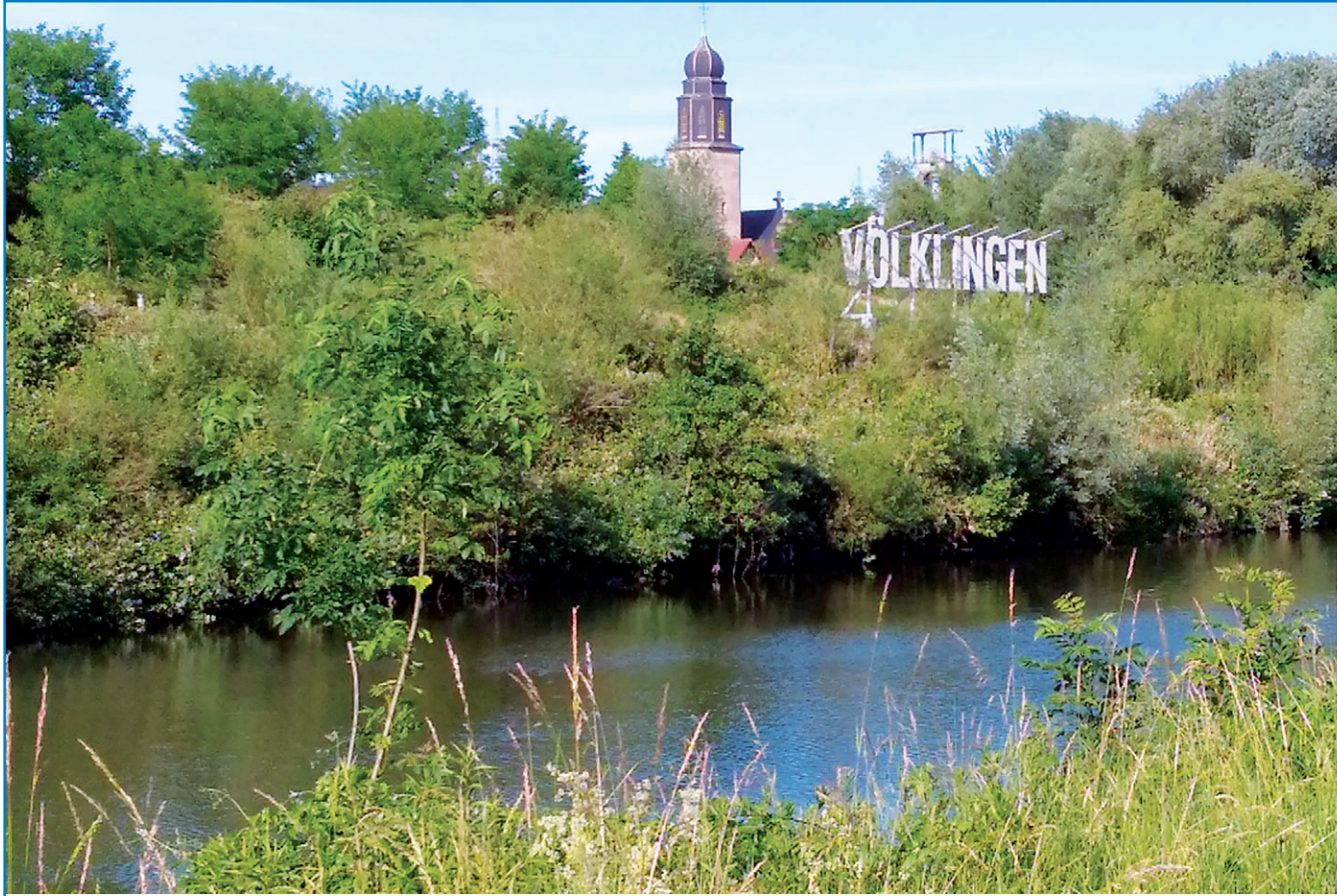
Völklingen im Grünen: Das Schild am Luisenthaler Saarufer ist ein Projekt der Völklinger Energiestiftung, das im Rahmen eines Ideenwettbewerbs auf Vorschlag des Völklinger Schülers Kaj Michaltzik im Jahr 2011 umgesetzt worden war. Im Jahr 2016 war der den berühmten Hollywoodlettern nachempfundene Schriftzug durch Asylbewerber, die eine Beschäftigungs- und Qualifizierungsmaßnahme (MIGRA-AGH) des Diakonischen Werks an der Saar absolvierten, renoviert worden.

Die Telefonnummer ist von Montag bis Freitag von 6 bis 19 Uhr erreichbar.