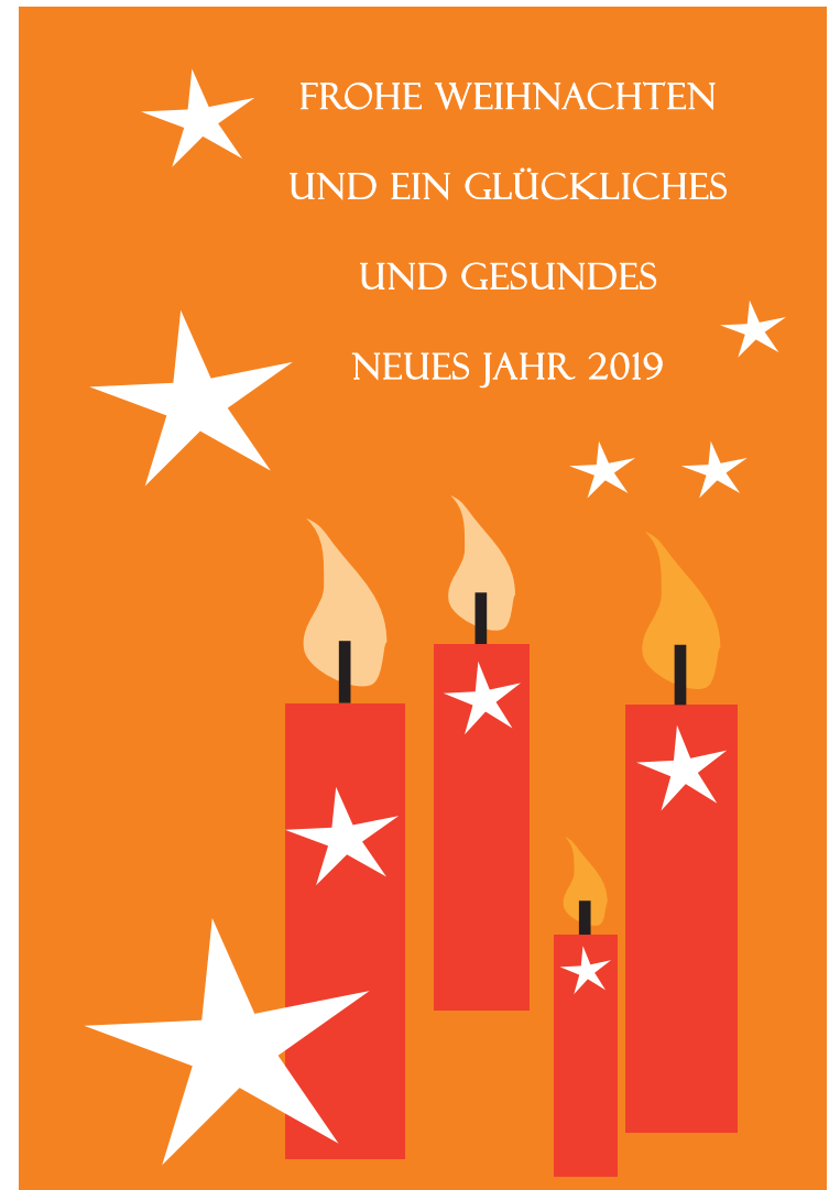
Christof Sellen Bürgermeister der Stadt Völklingen