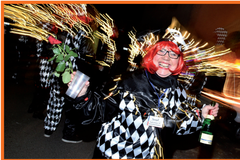
Gute Stimmung herrschte auch beim Nachtumzug in Wehrden