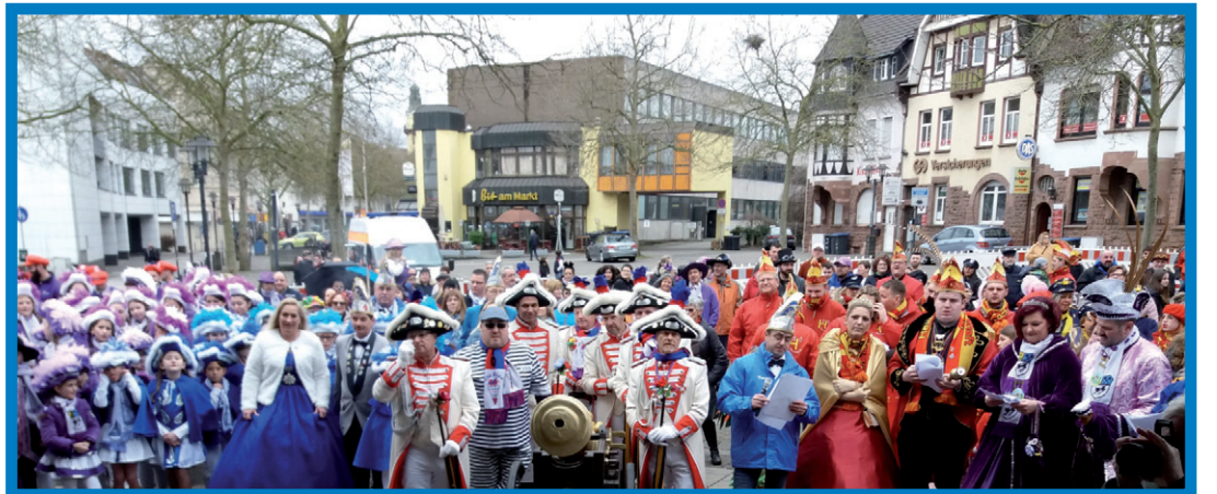
Die Völklinger Karnevalsvereine „Hoch das Bein“, „Die Braddler“, die AG Heidstock, „Die Rosselanos“ und „Die Beeles“ übernahmen beim Rathaussturm die Macht.