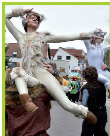
Auch in Völklingen - Heidstock ging es mit viel Musik und Spaß hoch her