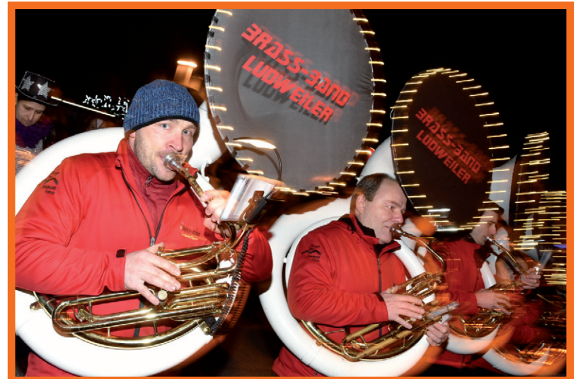
Die Brass-Band Ludweiler sorgte für den passenden Sound