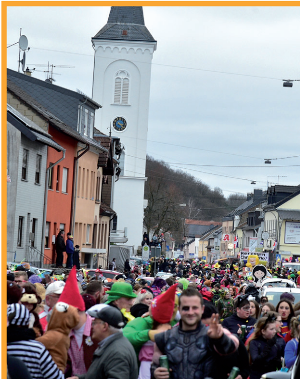
Der Gaudiwurm schlängelt sich durch Ludweiler

Für unverlangt eingesandte Artikel übernimmt die Redaktion keine Haftung.