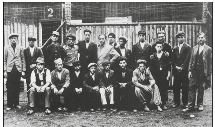
Zwangsarbeiter der Röchling-Werke in Völklingen