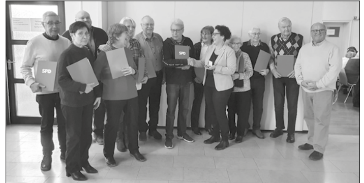
Die geehrten Jubilare der SPD Fürstenhausen