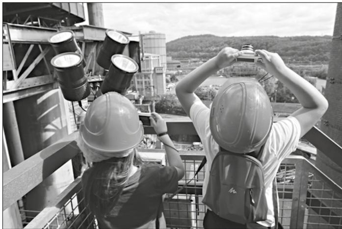
Expedition für Kinder im Weltkulturerbe Völklinger Hütte

15 Uhr: Das Weltkulturerbe Völklinger Hütte