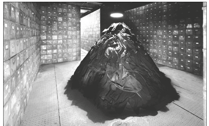
Christian Boltanski: Die Zwangsarbeiter – Erinnerungsort in der Völklinger Hütte