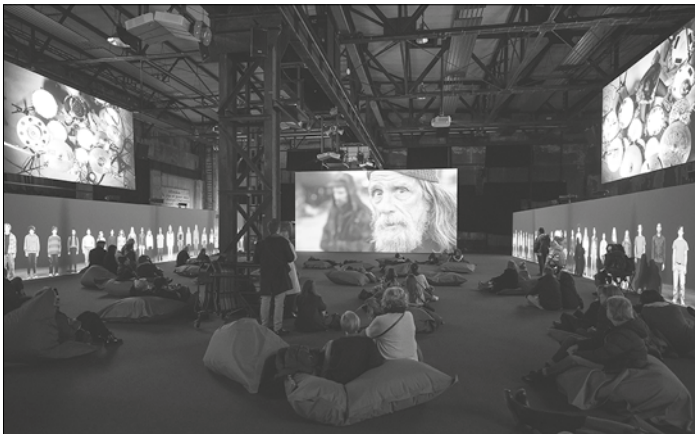
JULIAN ROSEFELDT. WHEN WE ARE GONE, Ausstellungsansicht

Die Führungen sind im normalen Eintritt in das Weltkulturerbe Völklinger Hütte enthalten.